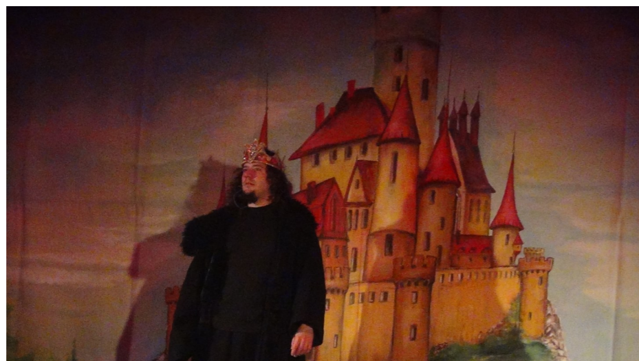
„Świat robotów”

W dniu 14.05 nasi uczniowie mogli wziąć udział w spektaklach przygotowanych dla nich przez Katolicki Teatr Edukacyjny z Krakowa. Klasy 0-3 oglądały „Królową Śnieżkę”, a klasy 4-6 „Świat robotów”.