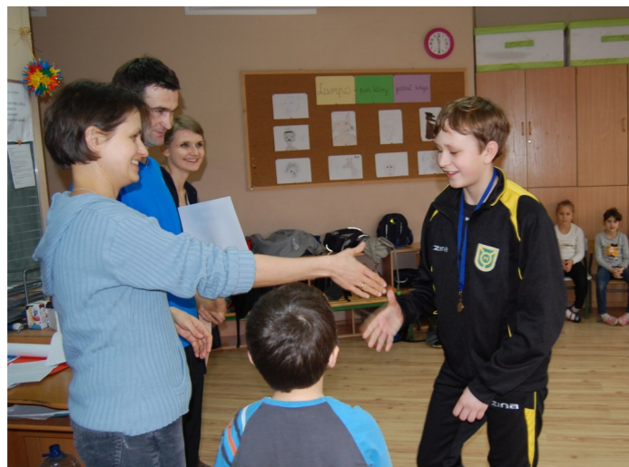
Pani Dyrektorka w swoim żywiole – w pracy z młodzieżą, tu podczas ferii w szkole, fot. arch. red.

Moja praca jest bardzo ciekawa, polega na organizacji całego życia szkoły.