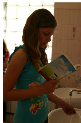
Na kanapie czy w łazience—nawet wtedy, gdy myję ręce!